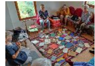
Tirage de contes