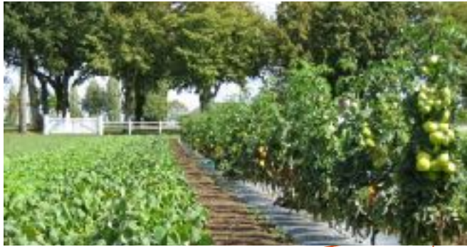
Jardin du Prieuré