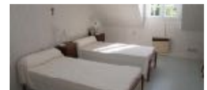
Chambre a plusieurs

« Un conte, c'est un message d'hier, destiné à demain, transmis à travers aujourd'hui ». (Amadou Hampâté Bâ)