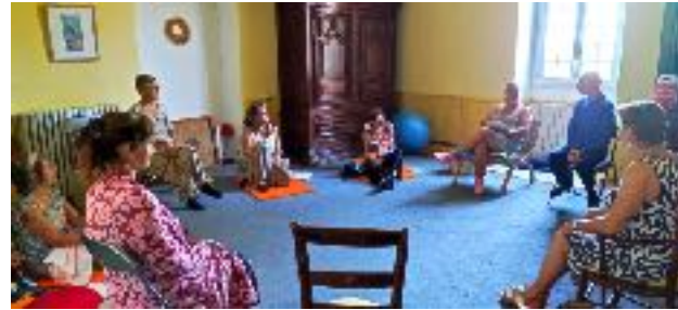
Salle de travail (autre lieu)