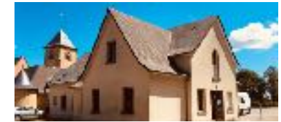
Accueil et boutique